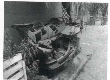
FRENTE DEL PREDIO DENUNCIADO