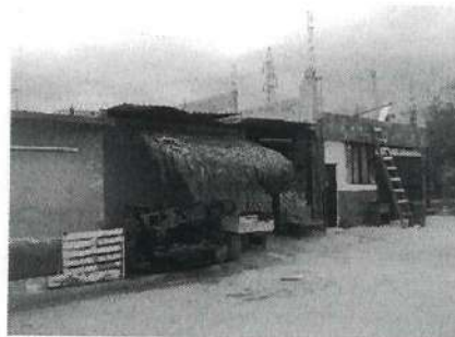
VISTA DEL INMUEBLE

Eliminado:9-Domicilio de persona física.