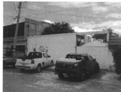
ARTICULOS ENCONTRADOS EN EL PREDIO SOLICITADO

Fundamento Legal: Acuerdo de Confidencialidad de fecha 12 de febrero del año 2021-dos mil veintiuno, por tratarse de información clasificada como confidencial en virtud de que contiene datos personales de conformidad con lo dispuesto en el artículo 141 de la Ley de Transparencia y Acceso a la Información Pública del Estado de Nuevo León y los Lineamientos en Materia de Clasificación y Desclasificación de la Información, así como para la Elaboración de Versiones Públicas de los Sujetos Obligados del Estado de Nuevo León.