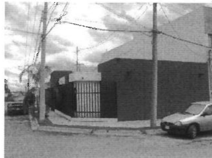
VISTA DEL PREDIO SOLICITADO