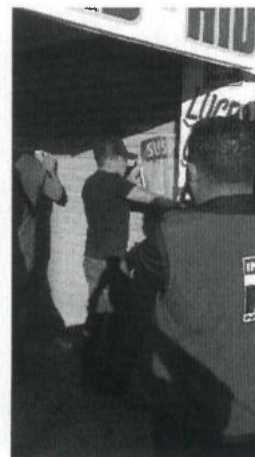
MATERIALIZACION DEL ESTADO DE SUSPENSION