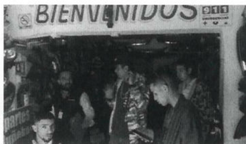
INTERIOR DEL LOCAL