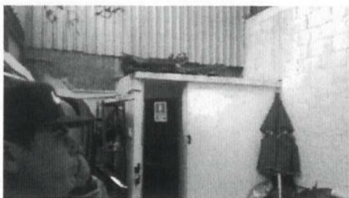
VISTA DE AREA LIBRE AL FONDO DEL LOTE