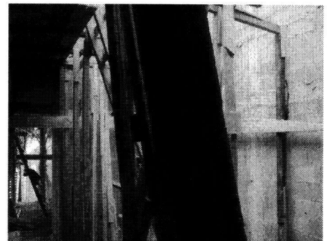
VISTA DE LOS TRABAJOS DE CONSTRUCCION