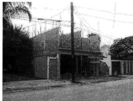
FRENTE DEL PREDIO DE REFERENCIA

ELIMINADO 1 PARRAFO: 5-Domicilio pe persona Física