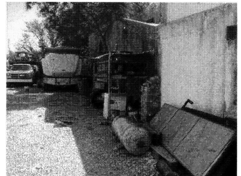
INTERIOR DEL PREDIO SOLICITADO