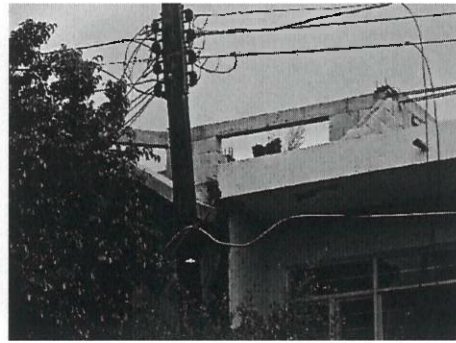
VISTA DEL PREDIO SOLICITADO