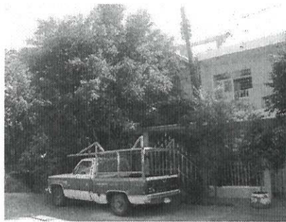
VISTA DEL PREDIO SOLICITADO