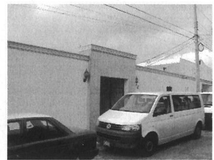
VISTA DEL PREDIO SOLICITADO