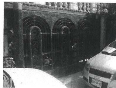
FRENTE DEL INMUEBLE DE REFERENCIA

ELIMINADO: Un párrafo. 11. Domicilio de persona física.