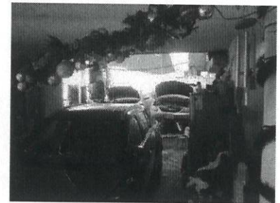
VISTA DEL AREA DE TALLER MECANICO DENTRO DEL PREDIO