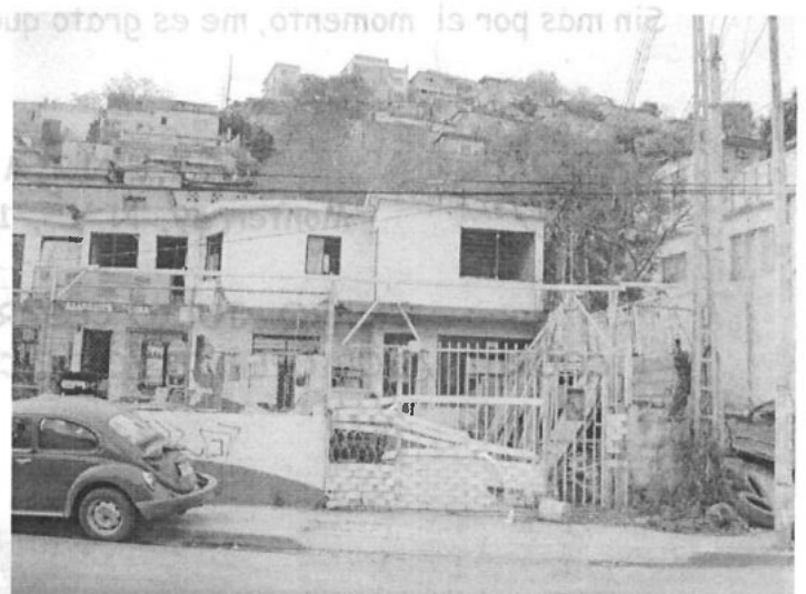
FRENTE DEL PREDIO SOLICITADO POR LA CALLE SANTOS CANTU SALINAS