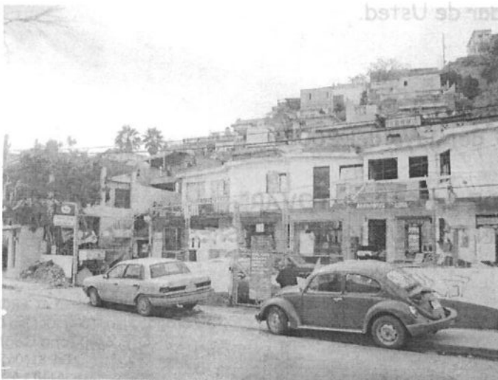
ACCESO AL AREA DE TALLER DE SOLDADURA (QUE SE UBICA AL FONDO DEL PREDIO)