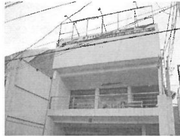
VISTA DEL PREDIO SOLICITADO

Fundamento Legal: Acuerdo de Confidencialidad de fecha 25 de febrero del año 2021-dos mil veintiuno, por tratarse de información clasificada como confidencial en virtud de que contiene datos personales de conformidad con lo dispuesto en el artículo 141 de la Ley de Transparencia y Acceso a la Información Pública del Estado de Nuevo León y los Lineamientos en Materia de Clasificación y Desclasificación de la Información, así como para la Elaboración de Versiones Públicas de los Sujetos Obligados del Estado de Nuevo León.